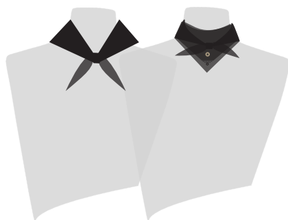
LE FOULARD LOSANGE BR® 2 VUELTAS