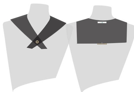
EL CUELLO MARIN