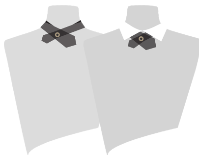
LA RENATE® BIKINI