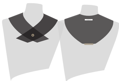
EL CUELLO BR®