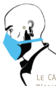
LE CANOT® ABIERTO MÁSCARA DE VISERA TEXTIL TRANSPIRABLE