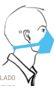
LE CANOT® SELLADO MASCARILLA DE PROTECCIÓN DE REVESTIMIENTO TEXTIL

UNA MÁSCARA SANITARIA CONFORME A LAS NORMAS E.U.