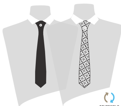
LA RENATE® REVERSO ANCHA