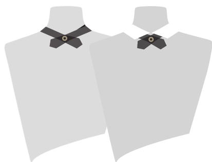
LA RENATE® PAPILLON