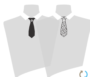
LA RENATE® REVERSO JOYA (MUJER)