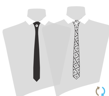
LA RENATE® REVERSO FINA